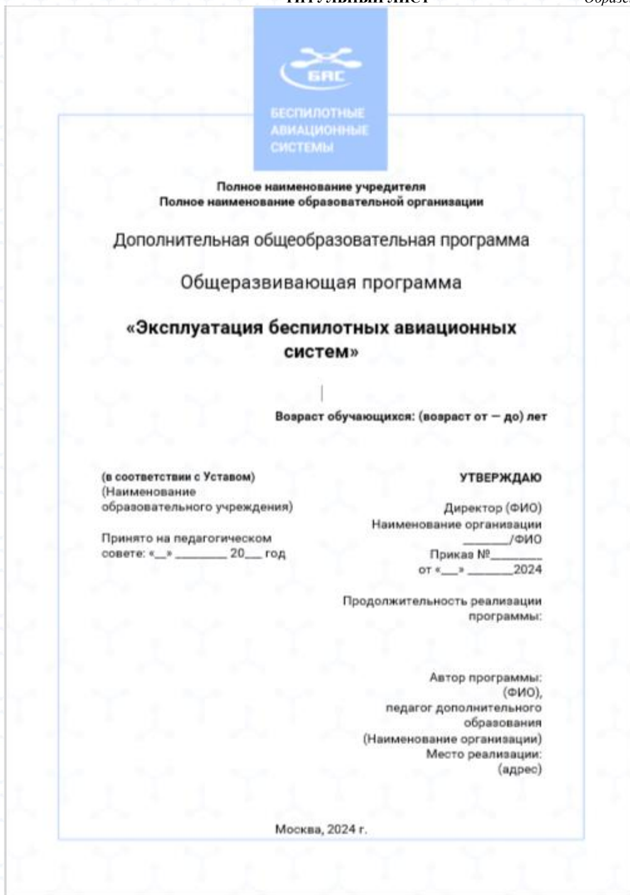
Рисунок 1. Образец титульного листа Программы