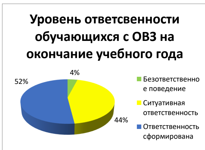
Рисунок 2 Уровень ответственности у обучающихся с ОВЗ на окончание учебного года

В ходе анализа проведенной работы в рамках реализации данной программы дополнительного образования мы увидели положительные результаты, и можем сказать, что участие в волонтерской деятельности помогает развитию у молодых людей таких личностных качеств, как общительность, уверенность в себе, бесконфликтность, эмпатия.