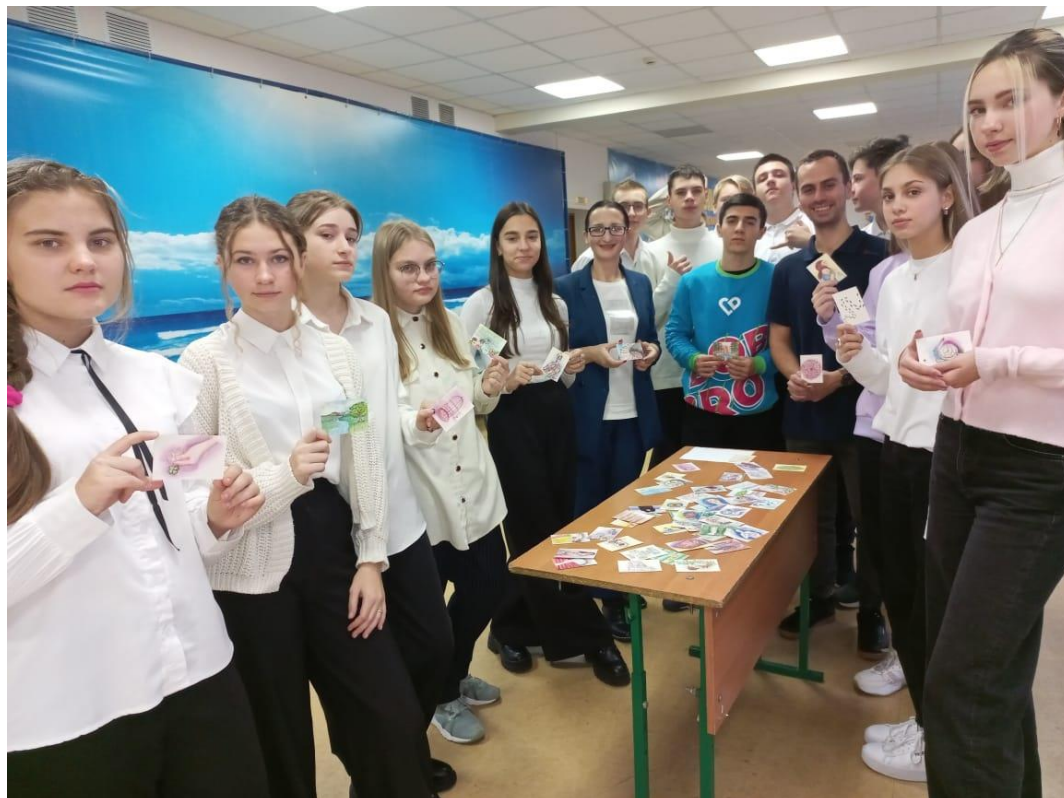
Рис. Нетворкинг встреча с учащимися девятых классов

Так на рисунке представлена встреча студентов второго курса специальности 44.02.01 Дошкольное образование с учащимися девятых классов МАОУ СОШ №11 им. Д.Л. Калараша г. Туапсе.