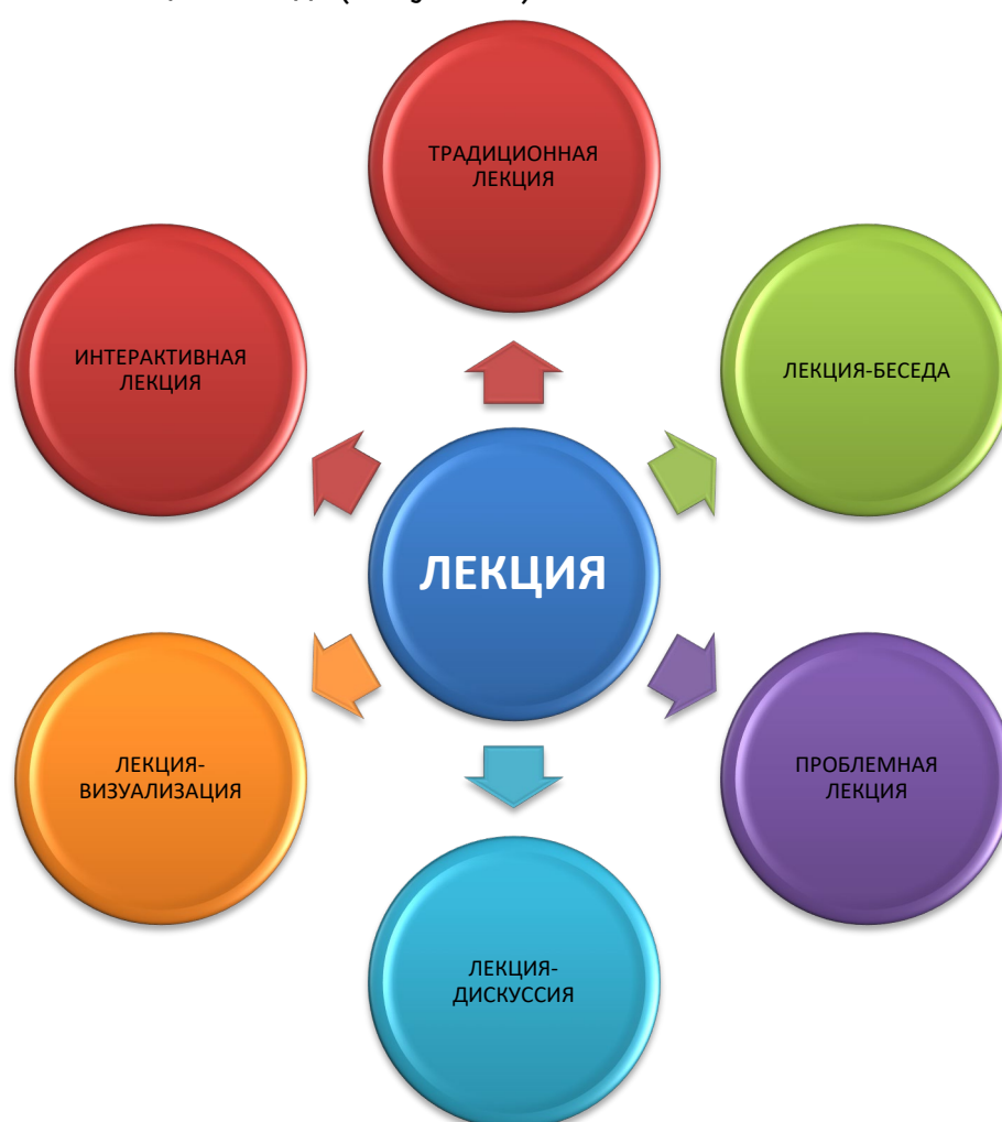
Рисунок 1. Виды лекций в системе среднего профессионального образования.

Анализ практики обучения в образовательных организациях среднего профессионального образования показывает, что преподаватели в своей практике наиболее часто используют: вводные лекции, традиционные лекции, лекции-беседы, проблемные лекции, лекции-дискуссии, лекции-визуализации, интерактивные лекции и т. д. (Рисунок 1).