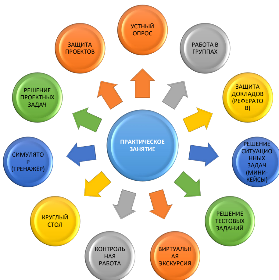
Рисунок 2. Виды практических занятий в системе среднего профессионального образования.

Среди наиболее часто встречающихся в педагогической практике можно выделить следующие виды практических занятий: устный опрос, работа в группах, защита докладов (рефератов), решение ситуационных задач (миникейсы), решение тестовых заданий, виртуальные экскурсии, контрольные работы, круглые столы, симуляторы (тренажёры), решение проектных задач, защита проектов и т.д. (Рисунок 2).