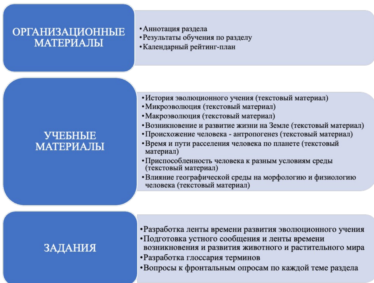
Рис. 1. Фрагмент структуры электронного курса по разделу “Теория эволюции”

Необходимость размещения результатов самостоятельной работы в электронном курсе делает ее выполнение обязательным для обучающихся, что дисциплинирует и повышает ответственность обучающихся. Ключевым механизмом стимулирования самостоятельной работы обучающихся является балльно-рейтинговая система, учитывающая результаты выполнения обучающимися заданий в электронном курсе в итоговой оценке за дисциплину.