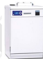
Система струйной отмывки печатных плат