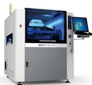
Автоматический принтер трафаретной печати

Оборудование участка автоматического монтажа и контроля, 218 ауд.