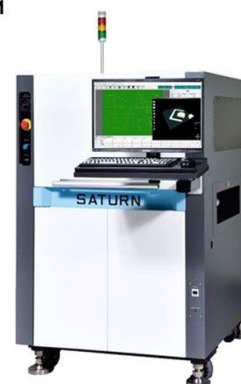
Линейная система АОИ 3D паяльной пасты