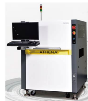
Линейная система АОИ печатных плат