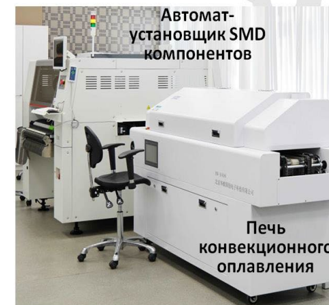
Автомат- установщик SMD компонентов